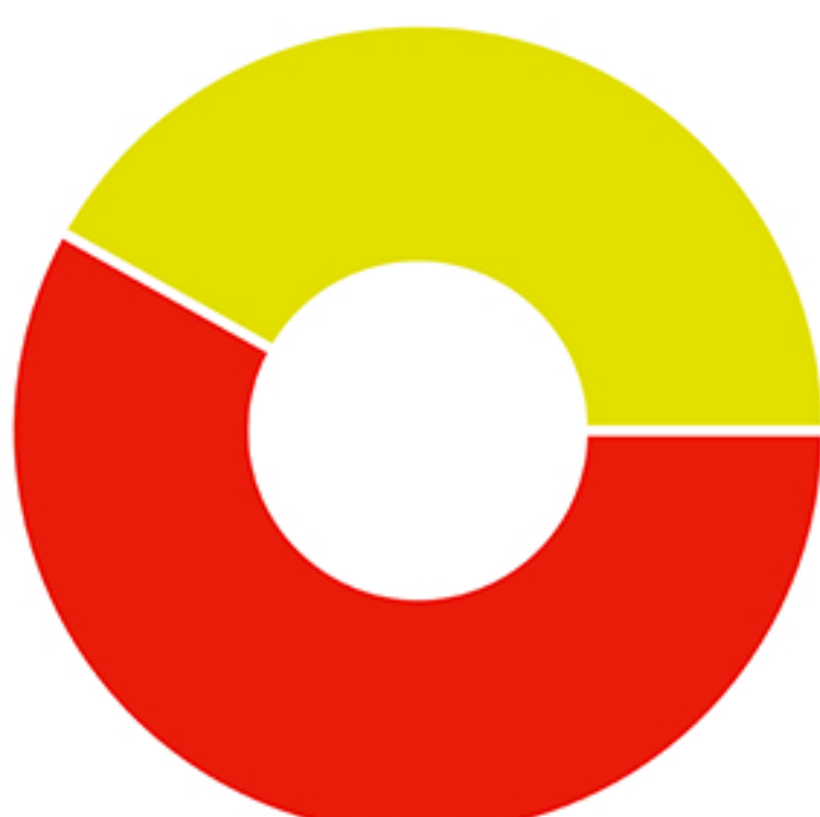
Ekvivalens energia fogyasztás

Villamos energia: 4 569 265 kWh Földgáz: 3 295 348,915 kWh