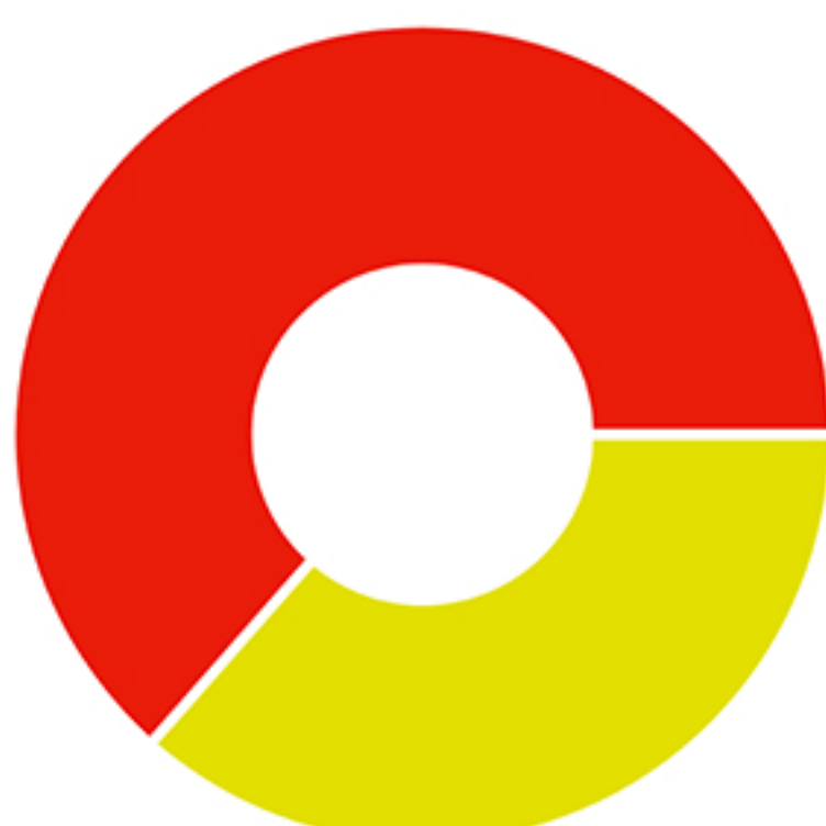
Ekvivalens energia fogyasztás

Földgáz: 2 949 758,635 kWh Villamos energia: 5 133 828 kWh