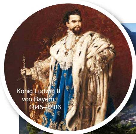
König Ludwig II von Bayern 1845–1886