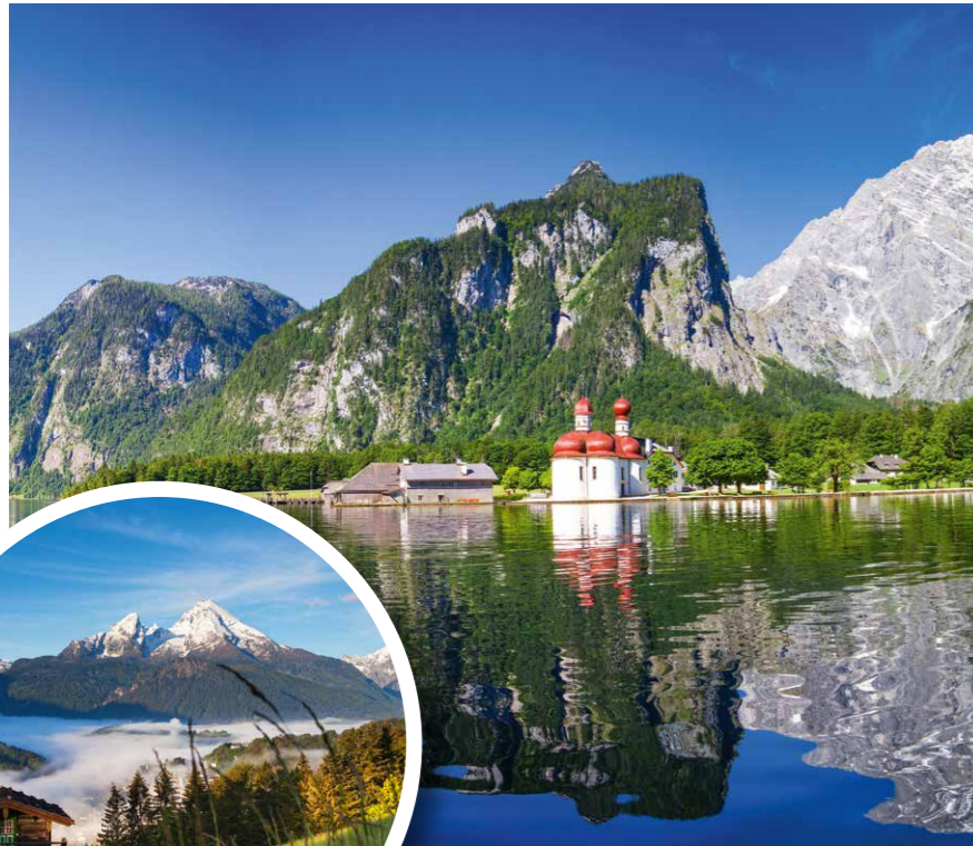
Der Watzmann, das Wahrzeichen des Berchtesgadener Landes