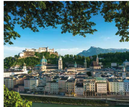
Salzburg, nur 20 Minuten entfernt