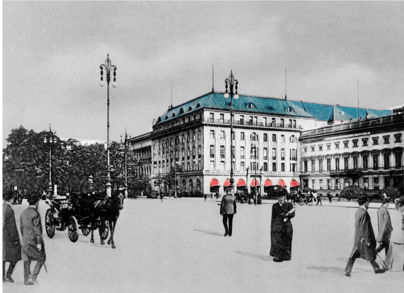
Hotel Adlon, 1926