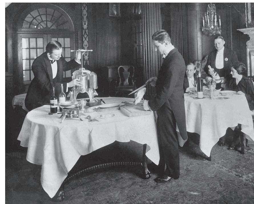
Service bei der Zubereitung der Sauce für den berühmten "Canard à la presse"

1964 - wird der Seitenflügel renoviert und bis 1970 als Hotel in der DDR weitergeführt 1984 - entscheidet das Politbüro der SED die Sprengung des Seitenflügels Am 23. August 1997 als Teil von Kempinski wiedereröffnet Spiegelt heute den klassischen Stil seines historischen Vorbilds wider