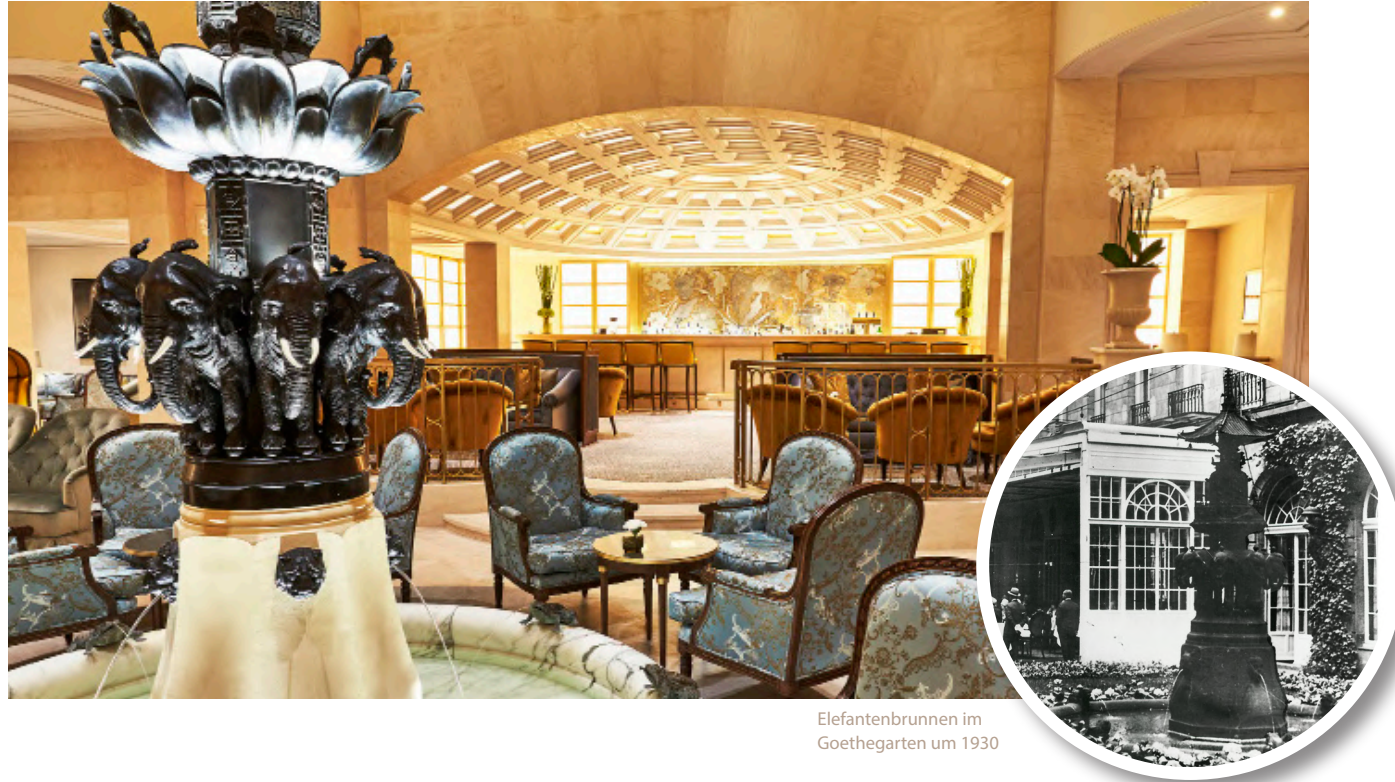
Elefantenbrunnen im Goethegarten um 1930